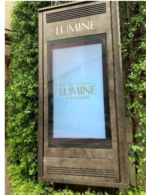
館内外デジタルサイネージ 約26ヶ所